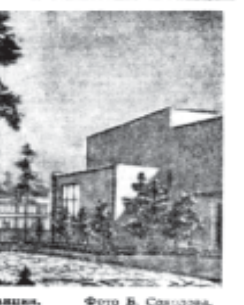
Таков будет поселок строителей и энергетиков неподалеку атомной станции.