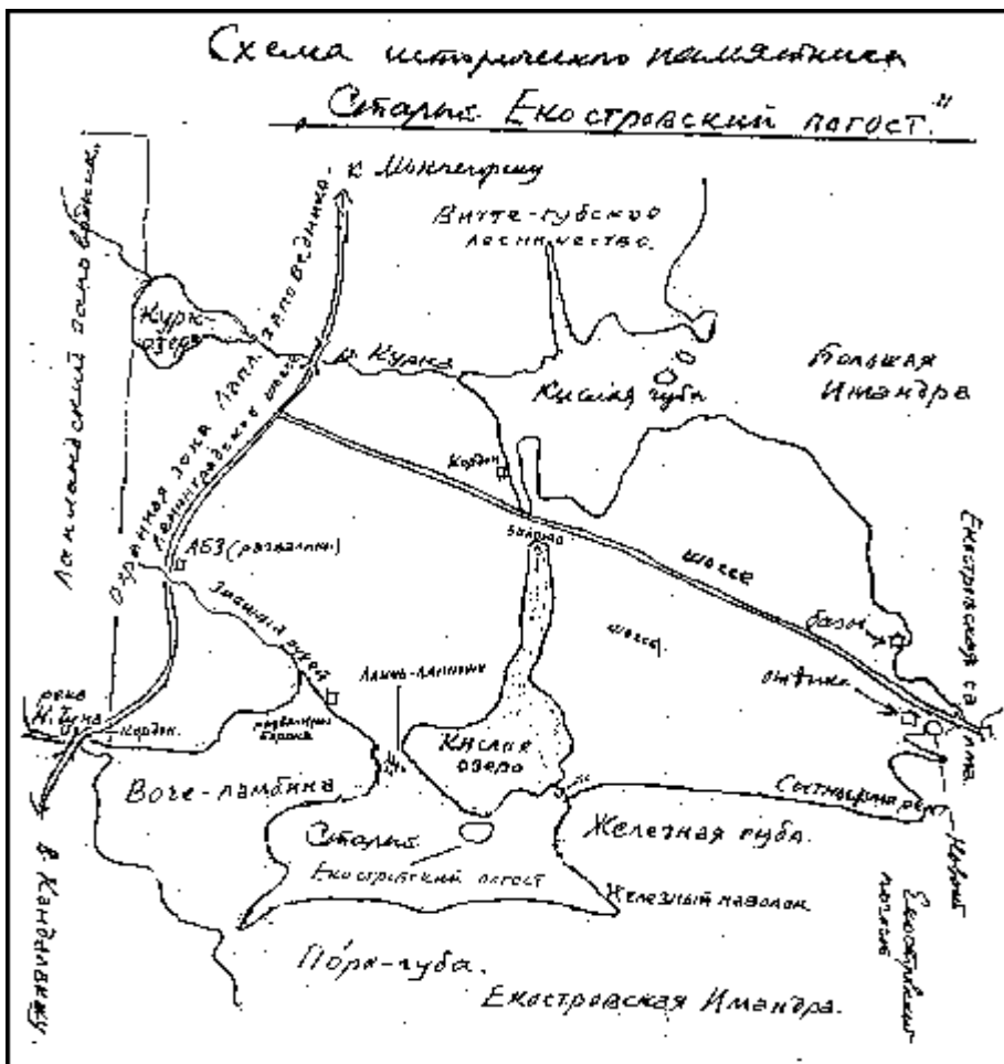
Рукописный план Екостровского погоста, составленный О.И. Семеновым-Тянь-Шанским

ца между последними двумя проводится через Роват-остров. Оз. Имандра упоминается в писцовых книгах 1608–1611 гг. как промысловое озеро бабинских, екостровских и отчасти масельских (ныне пулозерских) саами. С давних пор и до проведения Мурманской (Кировской) жел. дор. Имандра служила основным путем сообщения как в летнее, так и в зимнее время на маршруте Кандалакша–Кола и составляла часть одноименного почтового тракта. До проведения жел. дор. на берегах оз. Имандры было только 6 небольших населенных пунктов с населением не свыше 180 чел. К 1938 г. население, живущее по берегам оз. Имандры и ее заливов, превышало 25000 чел. Водная площадь 880 кв. км (Рихтер) или 816 кв. км (Атлас Мурманской обл.); водосбор 12830 кв. км; высота зеркала 126 м абс., наибольшая глубина 67 м. Проливами делится на три части: Большую, Екостровскую и Бабинскую.