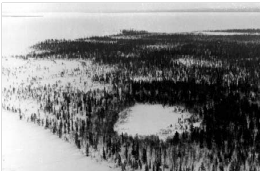
На этой фотографии, снятой с воздуха в марте 1977 г. О.И. Семеновым-Тян-Шанским, Старое Йокостровское кентиче похоже на круглое озерко среди леса, слева перед ним Кислое озеро, за ним Железная губа. На снимке вддали: слева, в виде темной полости - Облачный остров.

Капустное Озеро, Карельская Коммуна. 67° 10'