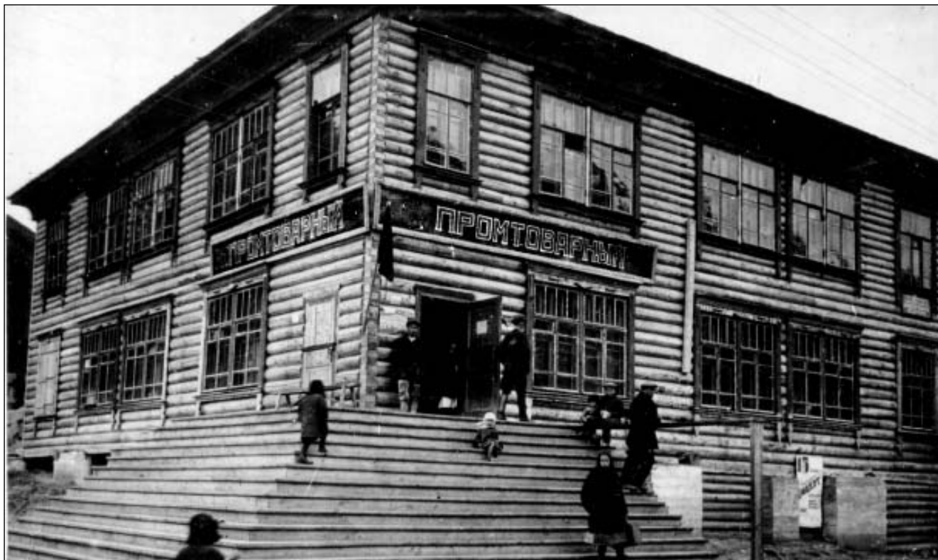
Открытие первого промтоварного магазина в Хибиногорске в 1932 г.

Кендзис-явр-варь, возвыш. 67° 40' : 32° 40'. (Гора (у) Узкого озера; кендзесь – узкий). К Ю от оз.