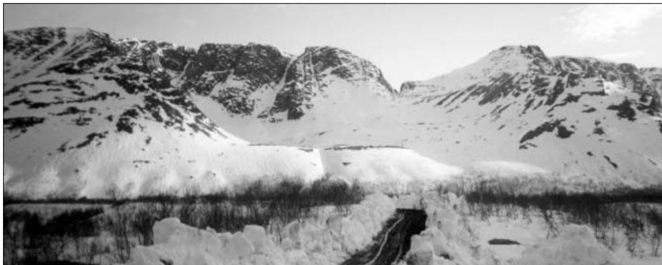
Ущелье Географов (цирк Ганешина). На переднем плане догга на рудник Кукис-вум-чорр

Дуруканский о. 66° 40' : 34° 10'. На р. Умбе ниже