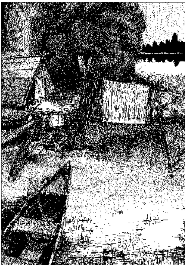
Лагерь геологов в устье реки Лутнерм-йок (р. М. Белая) в 1924 г. Рисунок М. Михайлова – первого директора Мурманского областного краеведческого музея

Вити-озеро, Виттен-явр. 67° 50' : 32° 30' – 32° 40'. Через озеро протекает р. Вити, впадающая в Вити-губу оз. Б. Имандры. Выс. 160 м. Площадь 187 га.