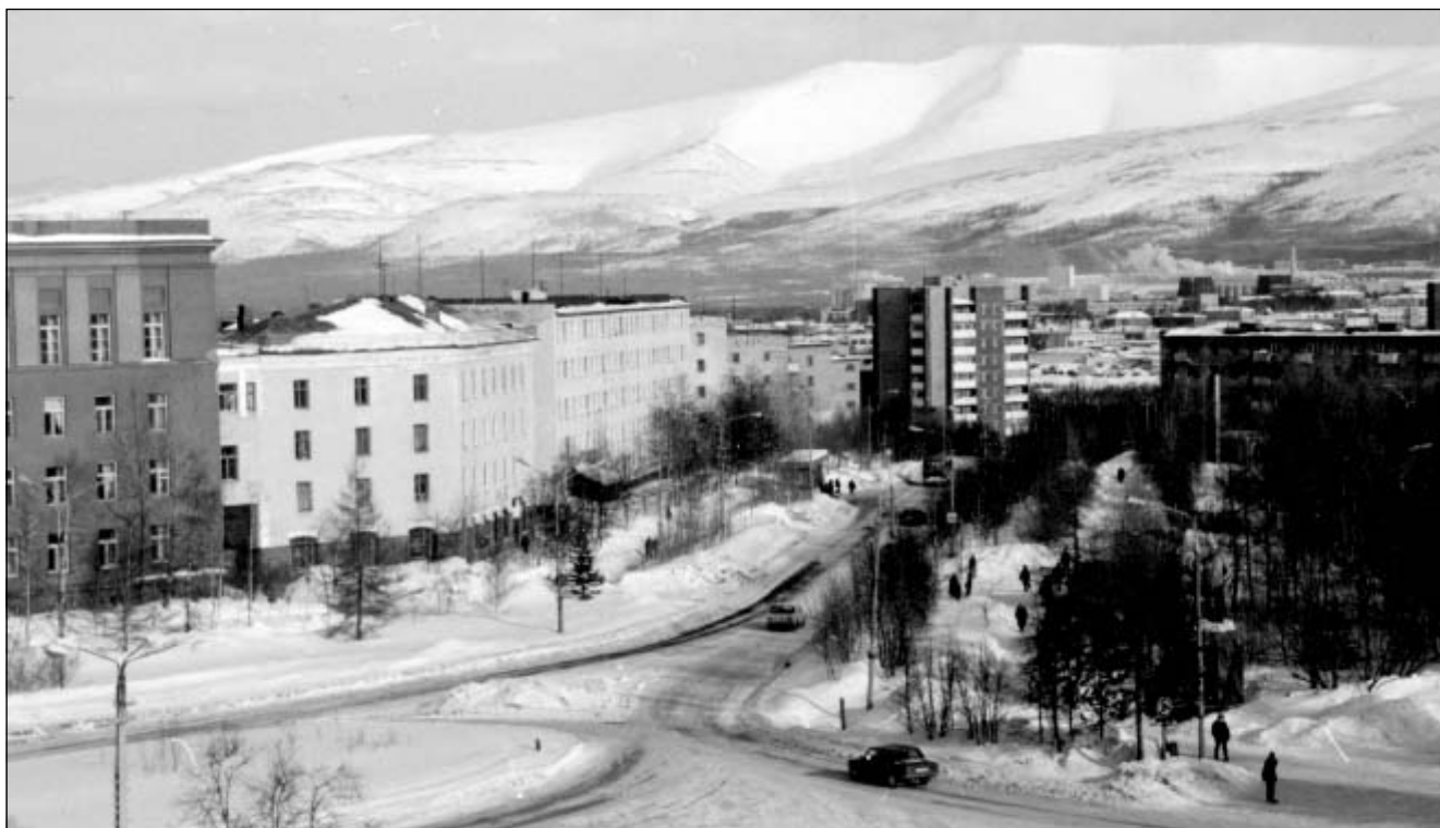
Улица Ферсмана в Апатитах. На заднем плане – хибинский горный хребет Тахтар-вум-чорр

впадения ее левого притока р. Вялы; один из Выстерицких островов.