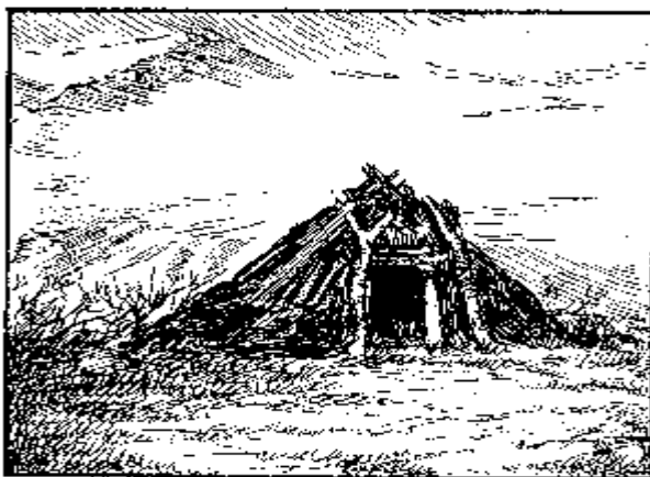
Вежа саама Василия Кобелева на берегу оз. М. Вудъявр

Вуйимь-тундра. 68° 00' : 31° 00' – 31° 10'. Сальная тундра. Высокая тундра в 10–20 км к северо-западу от Нявка-озера. Юго-западная оконечность Сальных тундр в верховьях р. Коньи, левого притока р. Печи (система р. Туломы); абс. выс. 915 м.