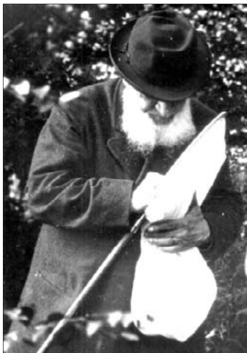
П.П. Семенов-Тян-Шанский за ловлей насекомых. 1912