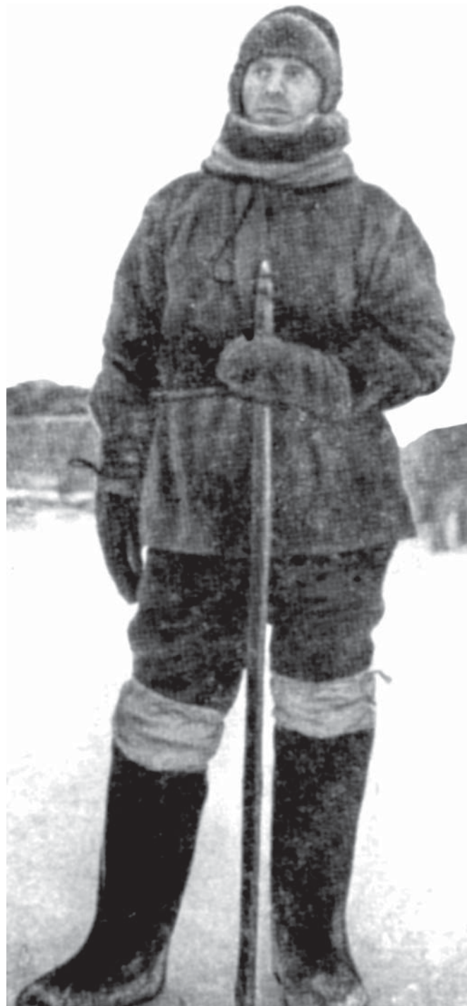
Г.Я. Седов перед походом к Северному полюсу (последняя фотография. 1914)