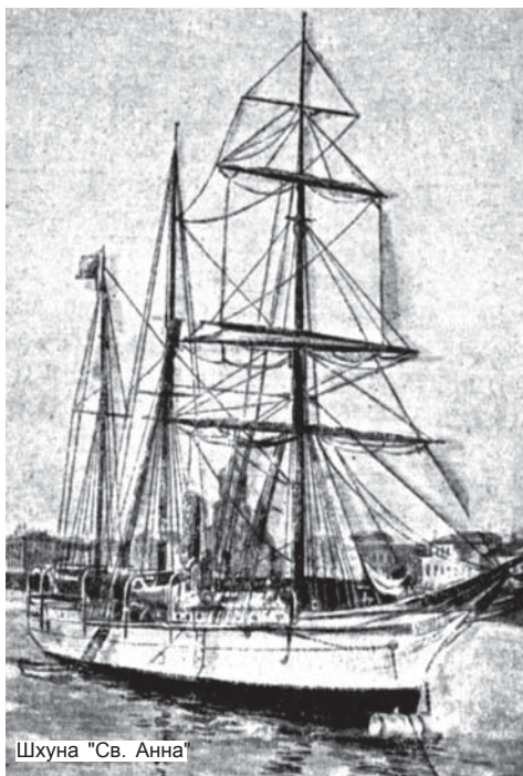
Шхуна "Св. Анна"

Славная, хотя и трагическая страница в историю освоения высоких широт Арктики вписана экспедицией лейтенанта Георгия Львовича Брусилова (1884-1914?) на шхуне "Святая Анна". Экспедиция в составе 24 человек отправилась из Александровска-на-Мурмане (Полярный) 28 августа. Брусилов стремился совершить сквозное плавание по Северному морскому пути и попутно за-