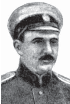
Лейтенант Г.Л. Брусилов

Славная, хотя и трагическая страница в историю освоения высоких широт Арктики вписана экспедицией лейтенанта Георгия Львовича Брусилова (1884-1914?) на шхуне "Святая Анна". Экспедиция в составе 24 человек отправилась из Александровска-на-Мурмане (Полярный) 28 августа. Брусилов стремился совершить сквозное плавание по Северному морскому пути и попутно за-