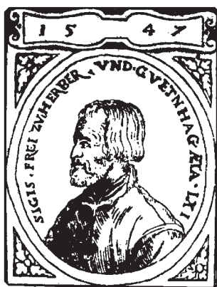
Портрет Герберштейна (Из «Gratae posteritati» Vienna, 1560)

пройти всего только три раза, и то лишь в XX веке. В 1903–1906 годах такое плавание совершил Р. Амундсен на судне "Йоа" в направлении с востока на запад, в 1941–1943 годах – Г. Ларсен на шхуне "Сент Рох" в направлении с запада на восток, и в 1944 году он же на той же шхуне в направлении с востока на запад.