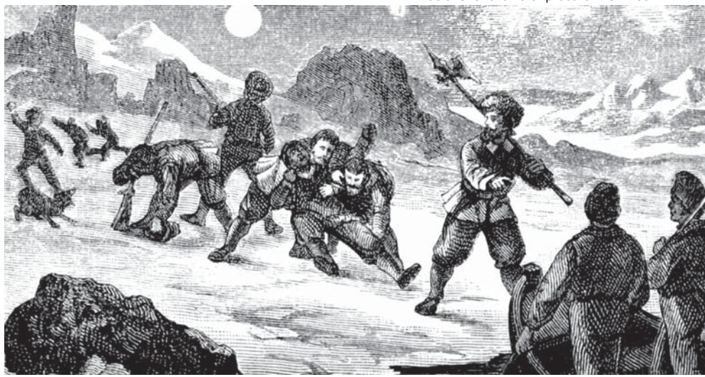
Frobisher's followers "procure" Eskimos