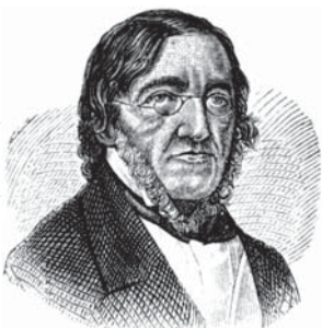
Карл Бэр (1792-1876)