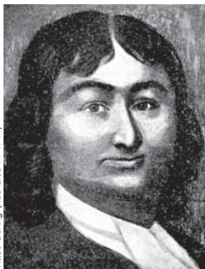
Витус Беринг (ум. в 1741 г.)

встретил сплошную массу льда. С трудом пройдя на несколько километров дальше – до 80^{\circ}48' с. ш., до острова Моффена, и поставив, таким образом, новый рекорд продвижения на север, Фипс поплыл на восток. Убедившись в том, что на 80 – 81 -й параллелях лежит "ледяной вал", не имеющий никаких проходов на север, он вынужден был повернуть обратно в Англию. Во время своего плавания Фипс проводил наблюдения над элементами земного магнетизма, определял температуру и влажность воздуха, изучал животный и растительный мир.