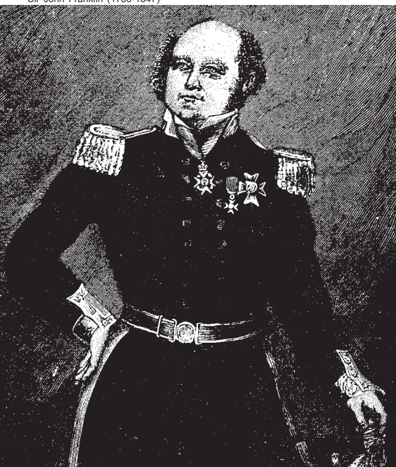
Сэр Джон Франклин (1786-1847)