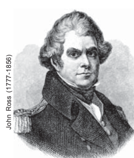
Джон Росс (1777-1856)

1732 – 17 апреля началось снаряжение Второй Камчатской (или Великой Северной) экспедиции под начальством Беринга (участники экспедиции покинули С.-Петербург в феврале 1733 года).