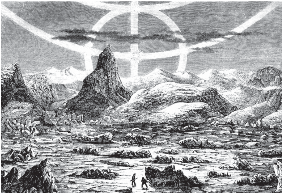
Prince Wilhelm's land in Greenland