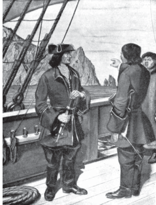
Bering's first expedition to Kamchatka