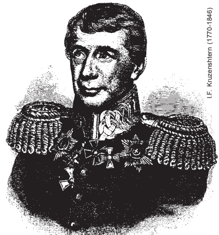
И.Ф. Крузенштерн (1770-1846)

от холода и голода (все законсервированные продукты оказались не год-