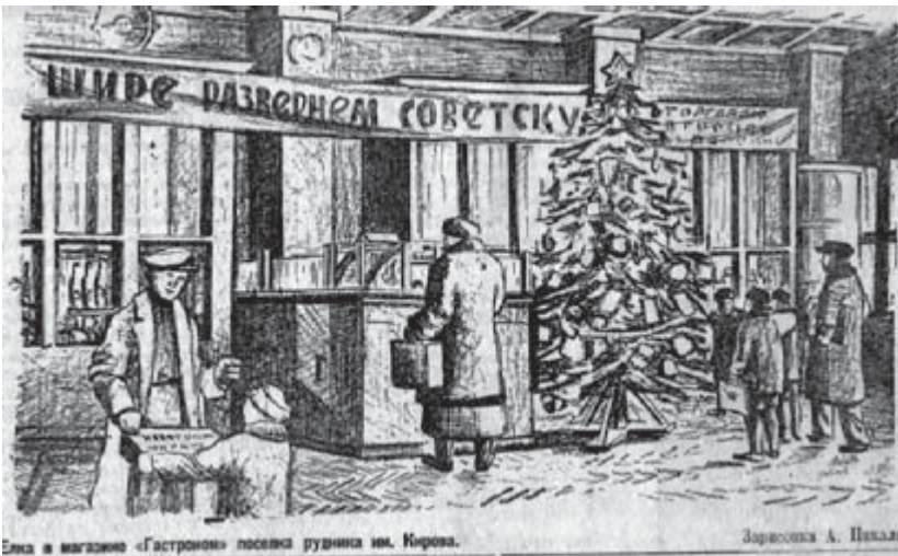
Елка в магазине «Гастроном» поселка рурника им. Кирова.

В рюмки только восень раз От тоски обедает.